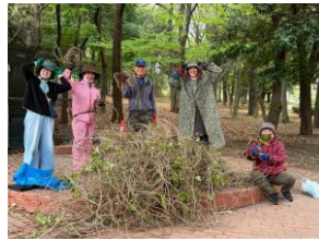
雨の中の作業 お疲れさまでした