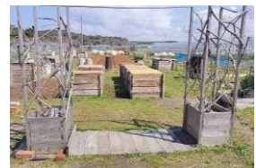
LFC・循環生活研究所